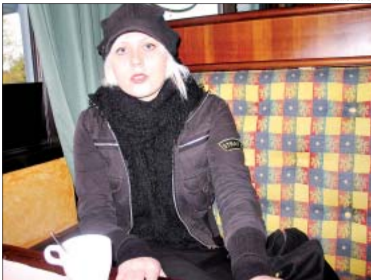
Grazy Maman mukaan adressin tavoitteena on, että eri puolilla Suomea syntyisi riittävästi ilmaisia, monipuolisia ja tilavia bänditiloja.